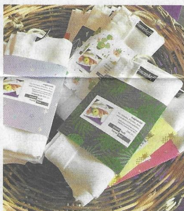
Vegiseckli Einzel oder Doppelpack