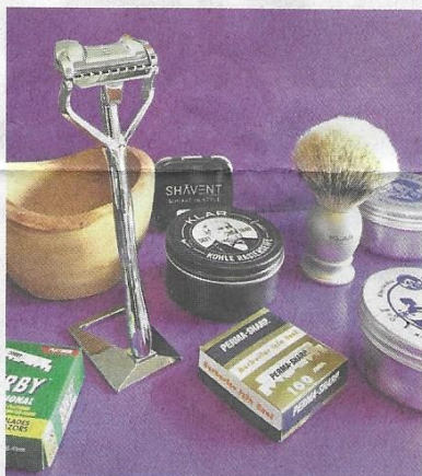
Shavent und Rasier Zubehör.

traumhaft-handfest Ruch & Schneibel Alte Dorfstrasse 21, 8704 Herrliberg Tel. 044 915 05 73 info@traumhaft-handfest.ch www.traumhaft-handfest.ch